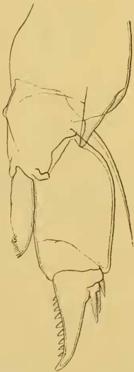
Fig. 5. — D. Schmackeri ♀. Patte droite de la cinquième paire.